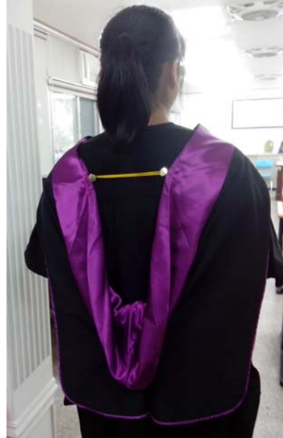
披肩穿戴方式(背面樣式)