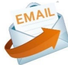
大專院校系所郵件